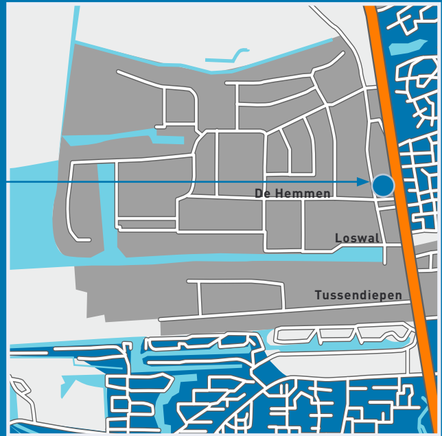
DE HEMMEN 6 T/M 8